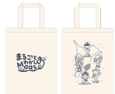
【オリジナルトートバッグ イメージ】